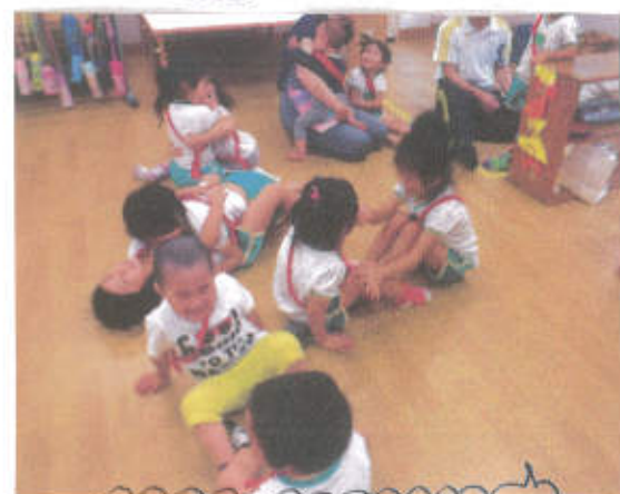
ふやあいあそび。笑顔がいっぱい!