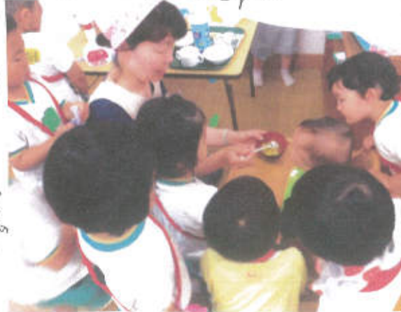
離乳食!! 興味津々です!