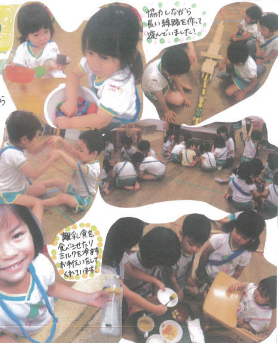
協力しながら 長い縄路を作って 遊んでいました!

朝の会の後にみんなが「パチパチトントン」の 触れ合いあそびをしました。最初は2人組から 始め、4人、8人...と人数を増やしながら 行ったのですが、以前もしたことがある遊び だったのでほとんどの子どもが自ら積極的に 参加し、楽しんでいました。中には恥ずかし がっている子どももいましたが、保育者が傍に ついて仲立ちをすることで誘いに来てくれた お友達と一緒に楽しむことが出来て いました。その後、3学期にある「杜の 発表会」について話し合いをしました。 どんなことを発表するのか意見を述べ たのですが「赤ちゃん(乳児)も出来るかな？」 と保育者が問い掛けると「おしえてあげ るねん!!」と年下のお友達のことを思い やりながら話し合っていましたよ。性越