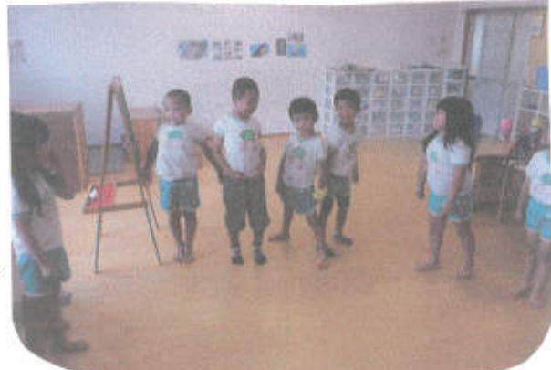
行進とかけこの役割に合わせて自分のポジションについてみました。