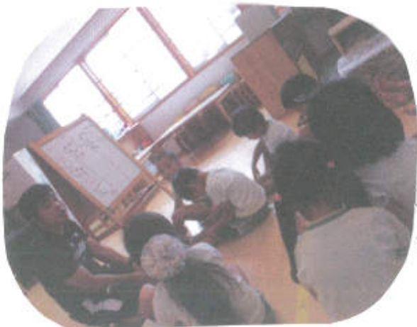
← 自分がどのポジションにつきたいのかを話し合ったり、どんなふうにしたいのか話し合いました。