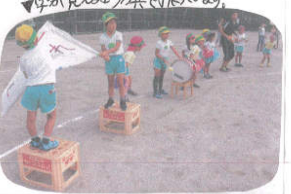
中が見える旗を振っています。