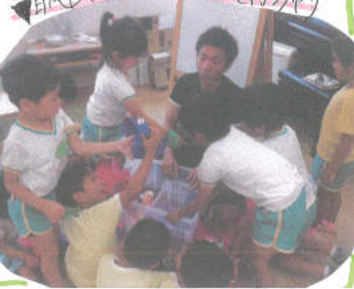
自分達で作ったポスターや楽器を持ち帰り