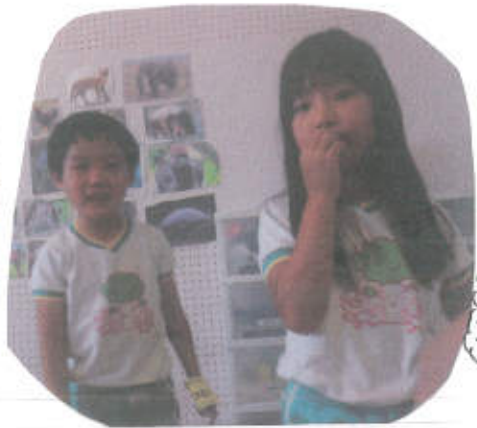
本山 「グループに分かれて発表!!」