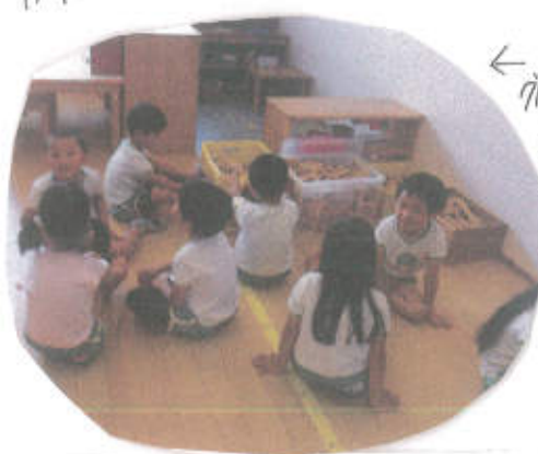
←グループで話し合いをし、振り返りをします。

今回は、運動会の振り返りをしました。行進の時のグループに別れて話し合う子ども達。出来た事、難しかったことを思い出しながら話し合っていました。「リールは、違って難しかった!」、「リールみたい出来た」と自分達の感じたことを話し、時折、「ポンポンを渡してあげれた!」や「送り出しがしかりと出来た」と具体的な意見が出ると「私は、こんなこともできた!」と次々に発表していく姿もありました。また、難しかった所は、全員でどうすれば解決出来たかを話し合い、年下の子どもと関わる時にはこうして解決したらいいのでは!という意見を沢山出して次に繋げていける話し合いは、