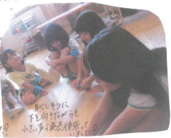
身じやうに下を向くとサカも小さい声で発表していました。