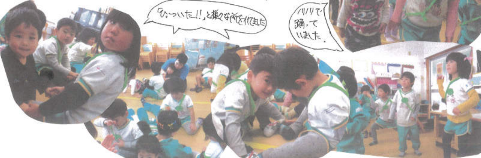
「わかった!!」と振り付けを決めた