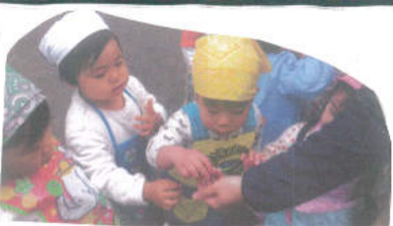
蒸す前の米粒を離れさせておこし

今回の活動では油揚げちまりのお手伝いをして後にもちつきをしました。油揚げは又ル又ルしていましたがとても楽しかったようで「もういっかい」と何度もお手伝いしてくれました! その後は園庭に降りますはもちつきの見学! お手伝いのお母さんたち「かんぱりー」と大きな声援をおくっていました! 次は子どもたちがもちつきに挑戦! 一度つくとも杵がもちから離れず「大苦戦!」しかし表情はどの子も真剣でした! 作ったもちもとてもおいしかったようで「食べてすぐは「おかわり」と言っていました!