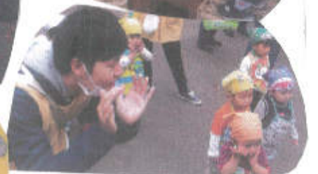
かんぱりー かんぱりー!