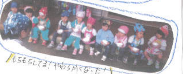
もちもちしてる! かわさけな、た!