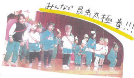
みんなの昆虫太極拳!!!