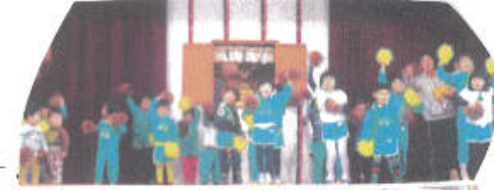
↑クラスでしかりと練習した。

今回は、発表会で「くーおきほー」とバナナの」をホールで発表しました。発表前は、クラスで練習をするとき久しぶりに集まって手遊びと体操をしました。しかしと覚えていた子どもたち、「くーおきほー」と大きな声を出したり、笑顔で体操を踊ったり、本番に向けて気分をあげていました。ホールでは、沢山見ている前で緊張する姿や恥ずかかっている子どももいましたが、「いっしょによう」といたり、年上の子どもが手を繋いであげて一緒に舞台上に上がる姿もありました。沢山緊張したり、踊ったからか、クラスに戻るには、「お腹減った!」と言ってみんなあーという間に給食を食べていました、本山