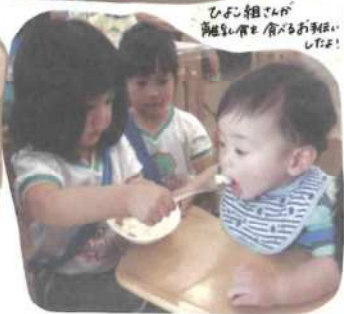
年少組さんが 鬼役をやるお友だち の様子！