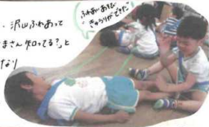
ふれあい遊び 「こちょこちょ」