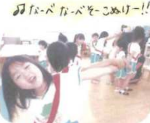
よばばこぼれこぼれ!!