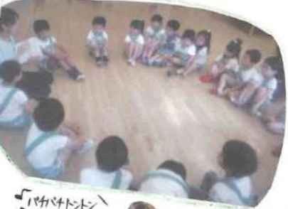
「やかやかトントン バカバカトントン！」

今年度、初めての杜の子ども会！！ 普段とは違う部屋に戸惑いながらも、 自己紹介や触れ合い遊びを通して打ち 解けてきてようで、次第に笑顔が増え 楽しく過ごすことが出来ました。