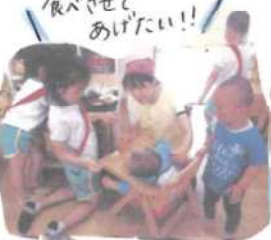
食べさせてあげたい!!