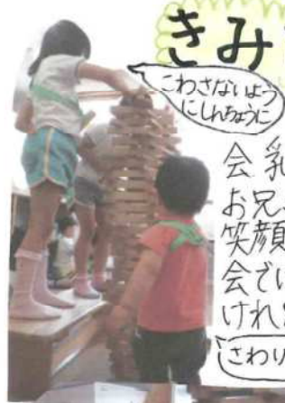
「わさなほよ にしほかに」

今年度、初めての杜の子ども 会。乳児クラスのお友達も知っている お兄さんお姉さんに安心したのか、 笑顔で過ごすことができました。朝の 会では、みんなにお名前を呼ばれてうれし いけれどちびっぴりはずかしそうにしてい ました。みんなであそびを楽しんだり、幼 児クラスのお友達が高く積み上げた ものを、重いの目で見ると見られ ました。新名