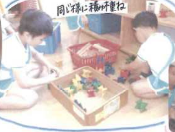
同じ様に福研重ね