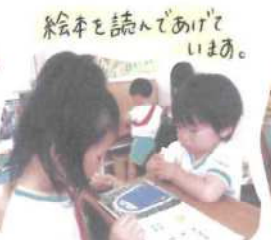
絵本を読んであげていよう。