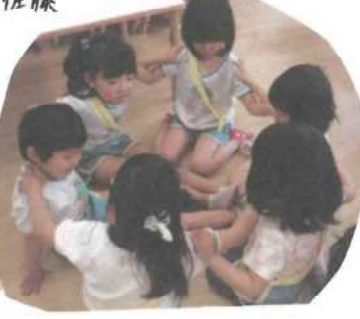
肩と肩、くっつくかな? どうしたらくっつくかな?