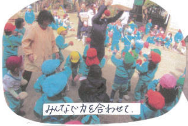
みんなが力を合わせて。