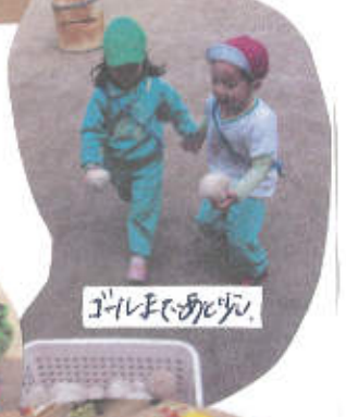
ゴールまでがんばり。