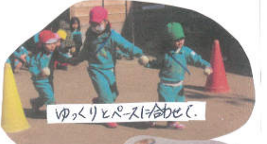
ゆっくりとペースを合わせて。

今回は、グループでの対抗戦をしました。対抗戦を行う前から、やる気満々の子どもたち。「1位になるぞ!」と気合いが十分でした。まずはじめに、異年齢でペアになり、リレーしました。ペアを作る時には、自分より小さい友だちと手を繋ぎ「一緒にやろう」と声を掛ける姿が見られました。ゲームが始まる時に、友だちの歩幅に合わせてはがら走り、白玉が取れずにいると代わりに取り、渡してあげたりと優しい気遣う様子がたくさん見られました。玉入れでは、みんなが力を合わせてカゴの中に溢れんばかりの玉を入れていました。玉を数える時には、真剣な表情、相手のカゴの中のものぐさ姿も見られました。結果発表では、ドキドキとした様子で、「1位」と発表されると「やったあ〜!」と大喜び、全身で喜びを表現し、みんなとても嬉しそうに顔を上げていました。 桑本