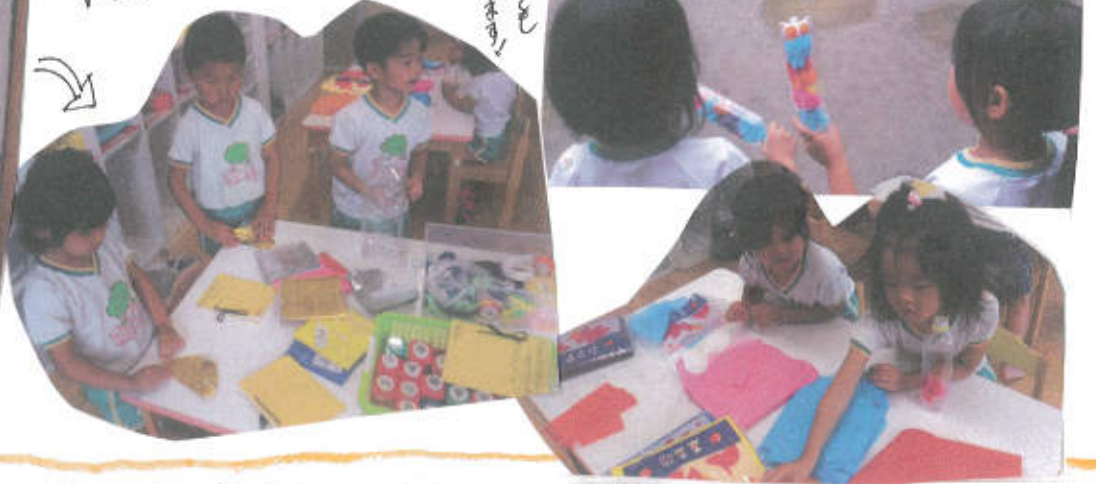
考えたものを使ってメガホン作り

なかになにをいれる? かるいもの ・おりがみ ・ストロー ・ビーズ ・かみ ・スポンジ ツボ クラフトパンチ お花紋 メガホン