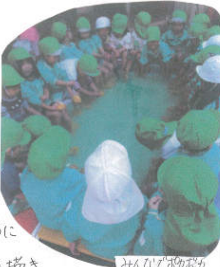
みかん足湯の様子