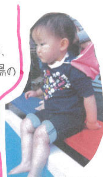
↑ みかんの足湯に入りました! ↑ みかんと一緒に食べるおいしね。

ひよこぐみ 今回の食育プロジェクトは、みかんづくしでした! みかんの足湯では、嫌がって泣く子どももいましたが、足をバタバタと動かしたり、手を湯の中につけたりと、足湯を楽しんでいる子どももいました。次に色々なみかんの食べ比べをしました。保育者がみかんの皮をむき始めると、またかなあといと見めていたひよこ組さん! つつと食べさせてあげると、モグモグと食べていました。でも、冷凍みかんは冷たかたよと、口の中に入れた瞬間、泣きそうな顔をしている子どももいました。後の焼きみかんやみかんあめはおいしく食べ、みかんと満喫したひよこ組さんでした! 森山