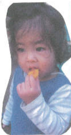
↑ 焼きみかんをモグモグ