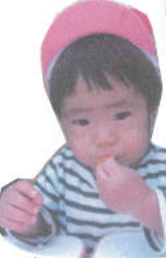
↑ 普通のみかんもおいしく食べました!

ひよこぐみ 今回の食育プロジェクトは、みかんづくしでした! みかんの足湯では、嫌がって泣く子どももいましたが、足をバタバタと動かしたり、手を湯の中につけたりと、足湯を楽しんでいる子どももいました。次に色々なみかんの食べ比べをしました。保育者がみかんの皮をむき始めると、またかなあといと見めていたひよこ組さん! つつと食べさせてあげると、モグモグと食べていました。でも、冷凍みかんは冷たかたよと、口の中に入れた瞬間、泣きそうな顔をしている子どももいました。後の焼きみかんやみかんあめはおいしく食べ、みかんと満喫したひよこ組さんでした! 森山