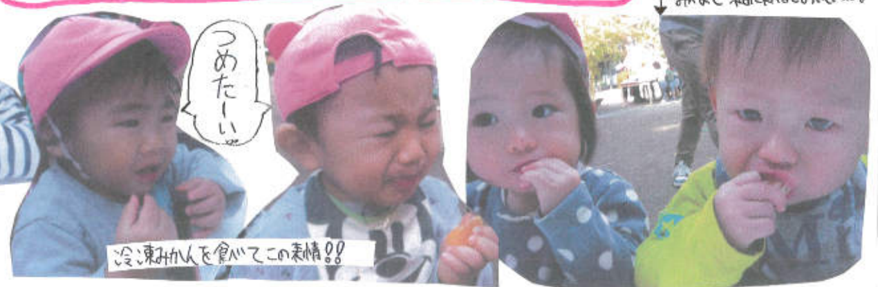
冷凍みかんを食べてこの表情!!