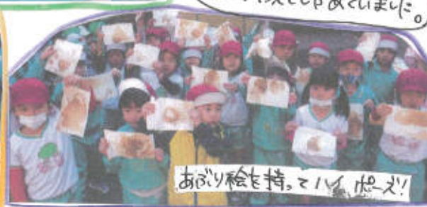
あぶり絵を持ち、ポーズ!