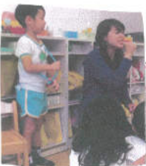
最後までじゃんけんに勝ち残った子どもには名前や好きな食べ物など聞いてインタビューをし、みんなに発表してもらいました!