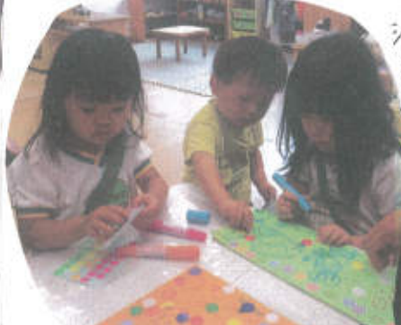
ペンシールやお当番カードを可愛くアレンジしてくれています!!

前回あひびのついでに乳児もついでに楽しんでいたので今回もあひびのついでをしました。前回よりモルルを理解してあひびのついでで遊んでいる子ども達! あひびの中では、年下の友達に声を掛け、一緒に逃げたり、鬼になった友達に何をしたらいいのか声を掛けて教えてあげる姿が見られました。その後には当番グループを作り、名前を決めました。名前を決めると、はじめ自分の思いを通そうとする子どももいましたが、最後は友達に譲ってあげたり、乳児の意見も尊重してくれていました。当番カード作りでは、はじめはお兄ちゃんお姉ちゃんか後ろに描いたり、シールを貼る様子を見たり、乳児さんですが、途中からは、一緒に描いてシールを貼っていました。今後もあひびや当番活動を通して子ども達の関係作りをしたいと思います!! 中西