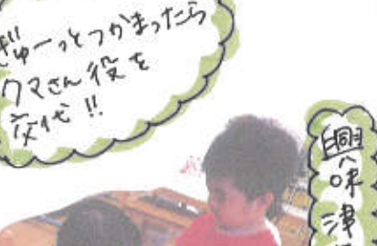
さびーをつかまるとクマさん役を交代!!