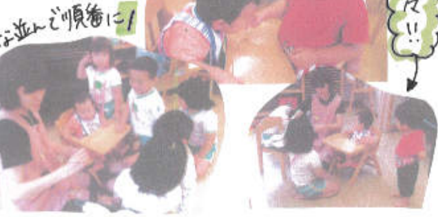
みんな並ぶ順番に!

離乳食が始まると、みんな集まってきました! 今回は、1歳児のお友だちも挑戦! 一度食べさせると興味を持ち、傾けお茶を待ちながら、様子を見ていました。スポンジを渡すと、嬉しそうに食べさせています。「00や、て〜」と頼るのはまだまだみんな先生です! 何のお友だちとの関わりを増やし、異年齢でのやり取りが増えればと思います!! 中川