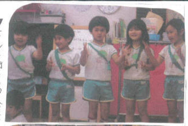
トイレに行っている友達を待つ間、手あひびをしてくれています!!