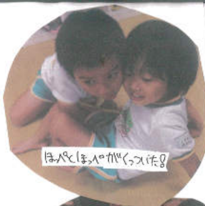
はなとほながくっつくついで

なななごぬけを全員でした時は、最初うまくいかなかったり失敗してしまったりもありましたが年長が「一番遠い人からくっついていこう」と前回の教えたもつたことを思い出し、他の子どもたちも教える姿が見られました。2回目は成功することができ、喜び合っていました。次に「おりんせ」をする前に遊びで知っているか子どもたちと関わり、年長・年中が「知っている歌も歌えるよ」と言う声が出たので知っている子どもたちを呼んで見本をしてみました。見本をした子どもたちも「電車になるぞ」と言う声になり、関所役を決めておりんせを始めました。低めの関所では少ししゃがみながらくっつく姿が見られ、関所がつかまる「キャー」と言ったりと声が上がると楽しい様子が見られました。 森山