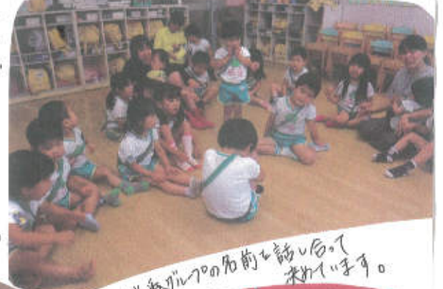
お当番グループの名前を話している様子です。