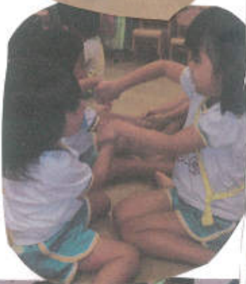
とおりんせとおりんせ