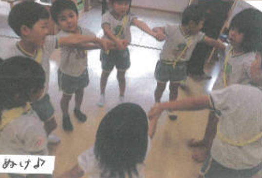
さやうりができた