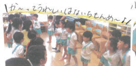
か〜、さやうりほはらもんめ〜!!