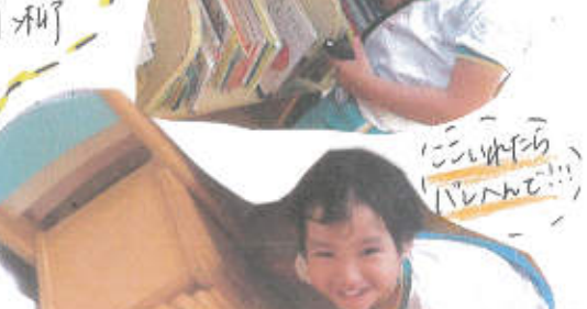
おぼろげにルールも!