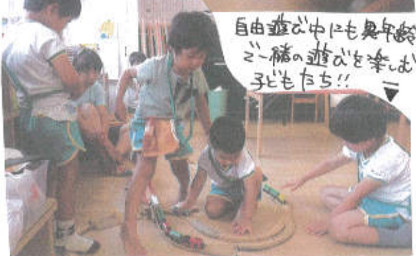
自由遊び中にも異年齢の遊びを楽しむ子どもたち!!