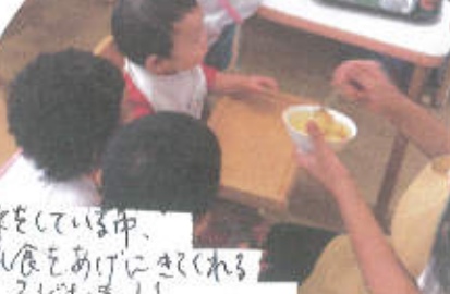
体操をしている中、お乳あげにきてくれる子ども達!!