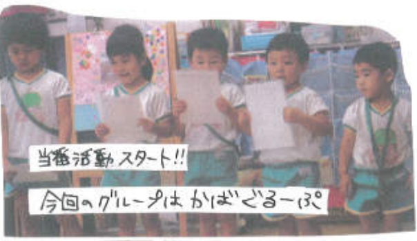
当番活動スタート!!

今回もみどりグループ恒例となつたあひだ、たからスタート!! 『ねた、そ手なごねん!!』と子ども同士で教え合ったり、乳児がオムツのおしりを温かく見守る、そわこわしました? そのあとは2月にある春の発表会に向けて話し合いをしました。体操、手あそび、歌、合奏の中から乳児も出来る物を選ぶように伝えると『かえる』がたなら簡単!!』と一人の子が『おと自然と全員でかえる』も歌い始めたり、たまたま思い出した自分のクラスで歌を提案する子どもも! 『体操がいい!!』と子どもも多かったです。試みにたこやまを流すと、リリリと踊り始め、終わると『ねたはバタバタスしたい!!』とリクエストが相次いでました。色んな事に取り組みながら子どもたちが楽しめる物を見つけたいと思います。