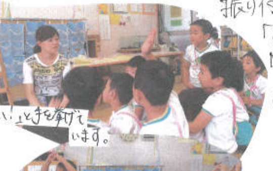
「はい、はい!」と手を挙げています。