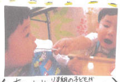
あーん!! リーダーの子も年長のお手伝い