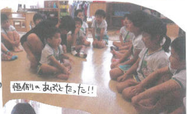
恒例のあひだとたから!!