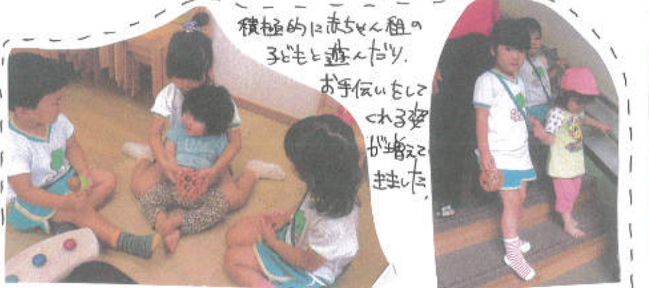
積極的に赤せん組の子も遊んで、お手伝いもしている姿が増えました。