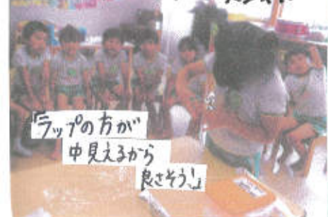
「ラップの方が中見えりから良さそう!」