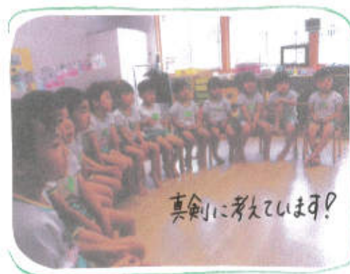
真剣に考えています?